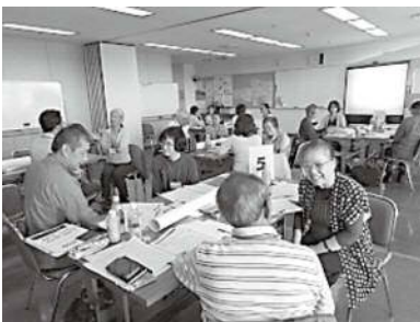
①市民活動推進センター職員や実際に地域で活動をしている方による、地域で活動を始めるための講義やワークを行う講座を実施

「地域福祉リーディングモデル事業」は、市社協が「誰もが安心して笑顔で暮らす福祉のまち名古屋の実現」を目指し、市内に「地域支えあい活動」を広げるために行っている事業です。地域支えあい活動の立ち上げと継続のための①知識や技術を学ぶ講座・②助成金「地域支えあい活動応援助成」・③「①」及び「②」事業利用者のためのフォローアップの3事業で成り立っています。この事業は、市民の皆様からのご寄付を原資とした「名古屋市福祉基金(地域福祉推進・子育て支援基金)」を活用しています。