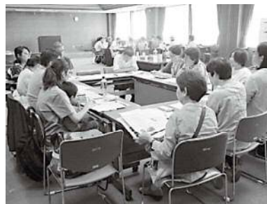
③助成団体同士の情報交換・交流の場、勉強会などを企画・実施